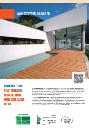
Doc. Expert Relais Bois

Un nouveau site Web mis en ligne le 15 mai 2013 se fera le relais de l'ensemble de ces conseils et explications, permettant un accès élargi aux informations précieuses et expertes du réseau : www.expertrelaisbois.fr