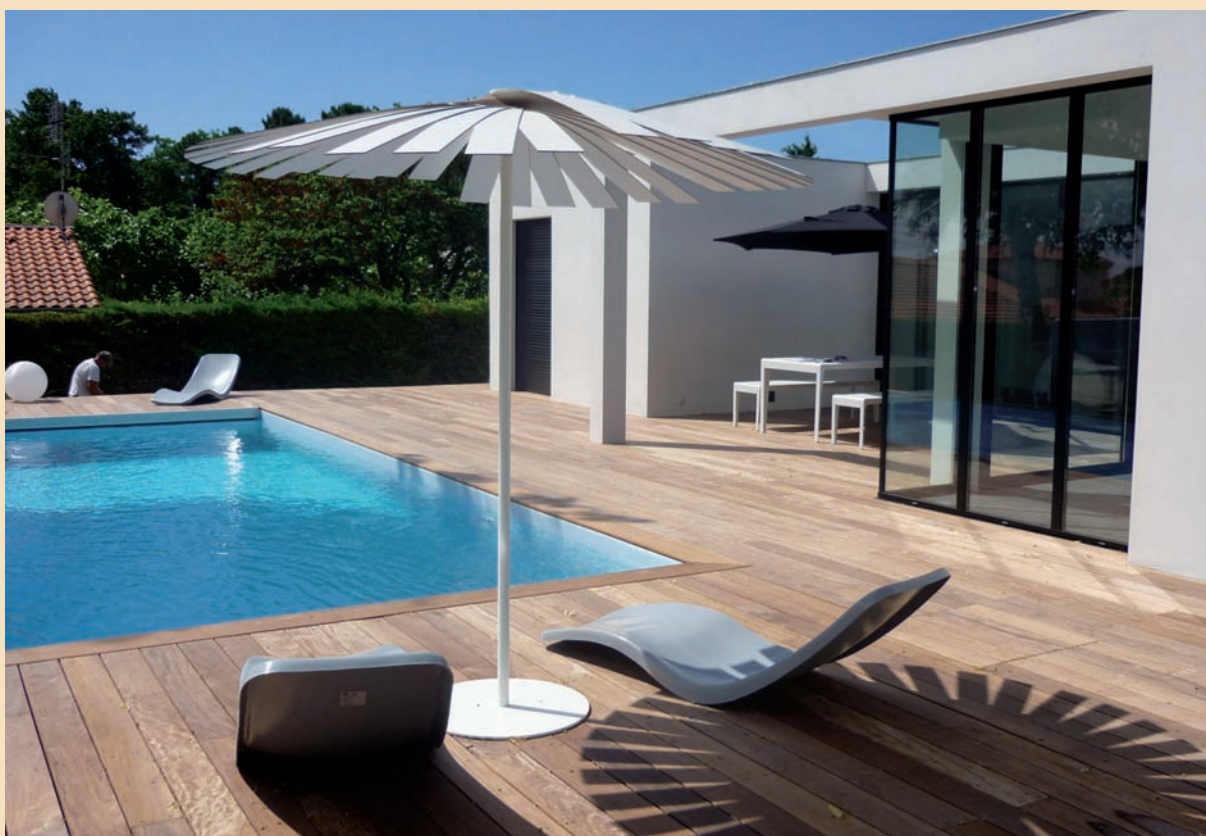
Doc. Expert Relais Bois / ATB - Propose Bois

Au cœur de la tendance et des évolutions culturelles actuelles, le bois revient sur le devant de la scène, en tant que matériau constructif aux nombreux avantages et multiples possibilités techniques. Esthétique, durable, isolant et écologique, il s'avère néanmoins assez peu connu du grand public et encore trop souvent délaissé au profit de solutions "imitations bois" qui en évoquent parfois l'esthétique, sans jamais égaler la qualité et la résistance du matériau.